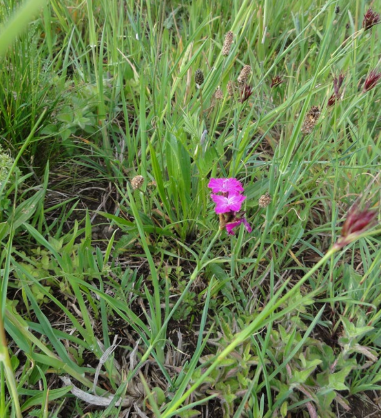
Karthäuser-Nelke (grünes handwerk - M. Ressel)