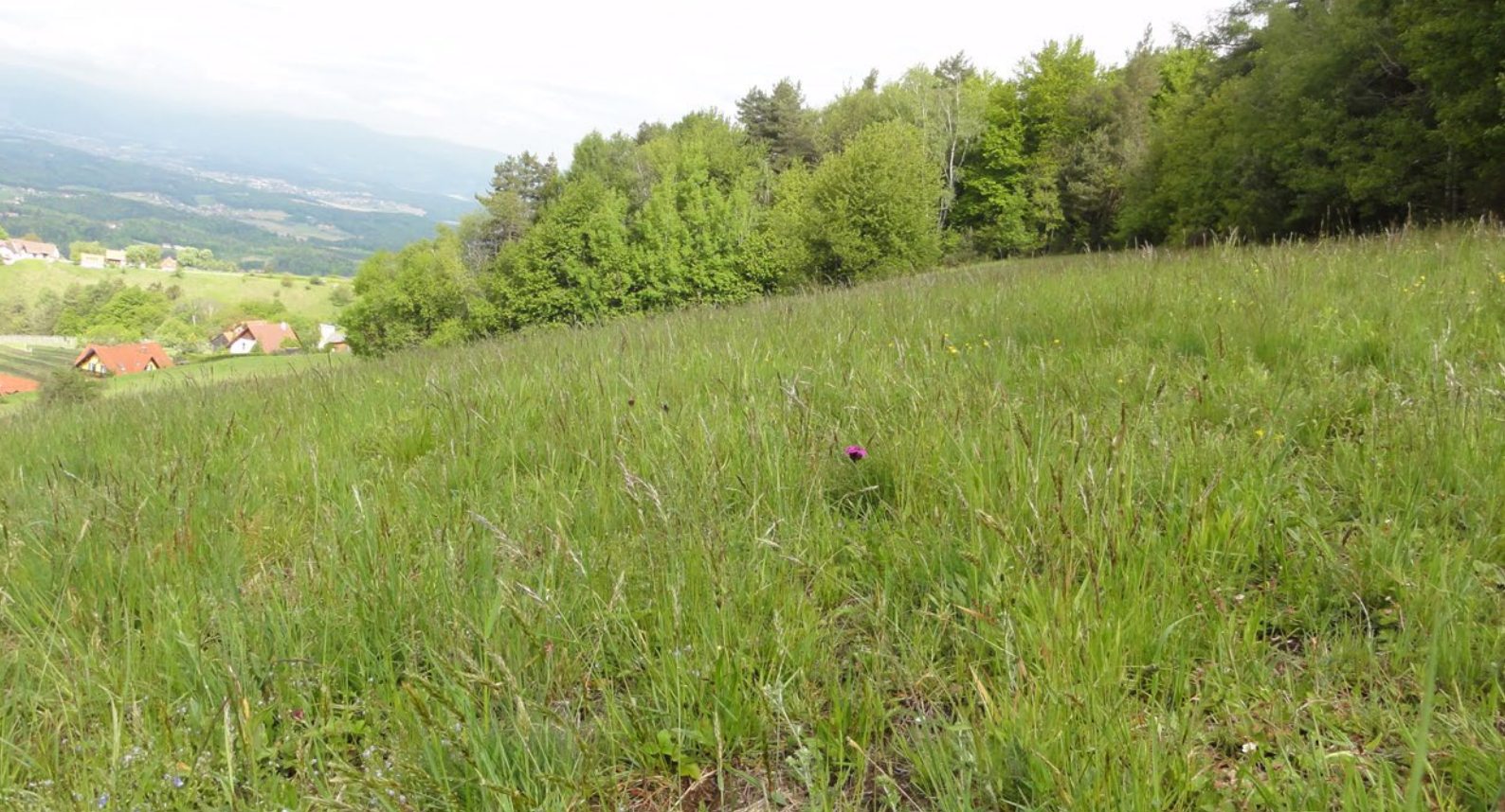
Schmetterlingswiese am Demmerkogel (grünes handwerk - M. Ressel)