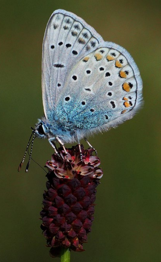
Gemeiner Bläuling