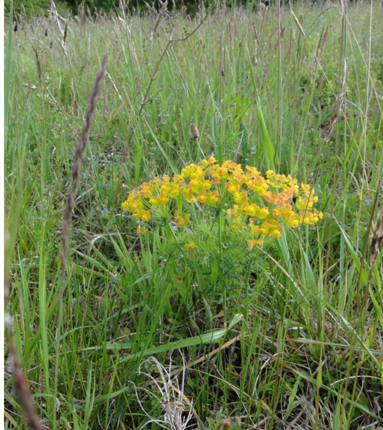
Zypressen-Wolfsmilch (grünes handwerk - M. Ressel)