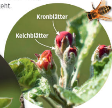
Kron- und Kelchblätter an einer Apfelblütenknospe