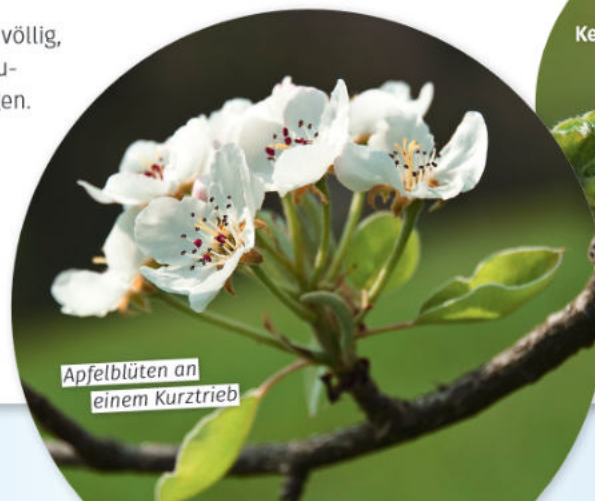
Apfelblüten an einem Kurztrieb

Spann die Netze über die niedrig hängenden Äste mit ausreichend Kurztrieben und befestige sie dann beispielsweise mit Klebeband oder Kabelbindern eng am Ast, sodass keine Insekten zu den Knospen kommen. Überprüfe das Netz regelmäßig auf Schäden wie kleine Löcher, damit dann bei der Party auch ja nix schief geht.