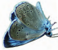
Helle Wiesenknopf- Ameisenbläuling

wie Knäuelgras, Wiesen-Lieschgras oder Glatthafer; unter den Kräutern sind u.a. Wiesen-Margerite, Wiesen-Glockenblume und Wilde Möhre zu nennen. Fettwiesen gedeihen auf Böden, die nährstoffreich und gut mit Wasser versorgt sind.